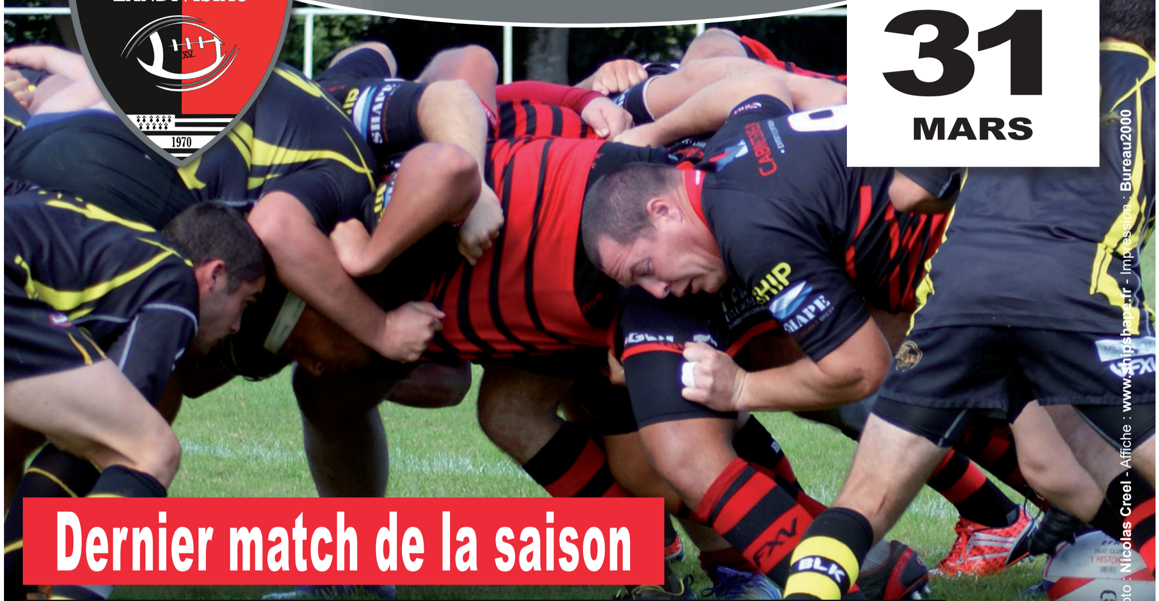
Affiche : www.shipshape.fr - Impression : Bureau2000